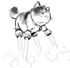
モチ/『ベイマックス』(2014年)