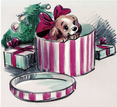
レディ/『わんわん物語』(1955年)

本展覧会では、ディズニー全てのアニメーション作品に関連するあらゆる資料を所蔵している アニメーション・リサーチ・ライブラリーの全面協力を得てデジタル化された貴重なアート作品を300点以上ご紹介いたします。