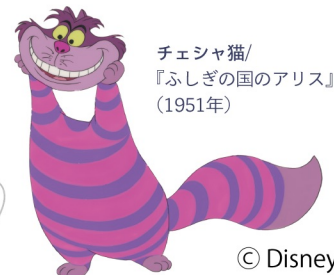
チェシャ猫/ 『ふしぎの国のアリス』 (1951年)