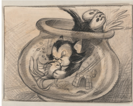
フィガロ/『ピノキオ』(1940年)