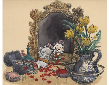
マリー/『おしゅれキャット』(1970年)