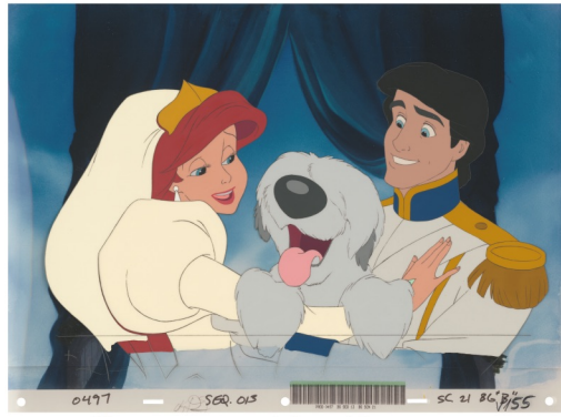
マックス/『リトル・マーメイド』(1989年)